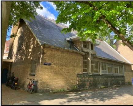
St. Gabriëlkerk Deurloostraat 17, 1078 HR Amsterdam