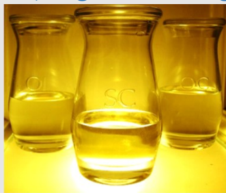
Ziekenolie - OI ("Oleum Infirmorum"); Heilig Chrisma - SC ("Sanctum Chrisma"); Catechumenenolie - OC ("Oleum Catechumenorum")

In de Goede week, de voorbereidingsweek voor Pasen vinden er tal van ceremoniën plaats die kracht bijzetten aan het opstandingsmysterie dat zich met Pasen voltrekt.