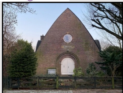
St. Raphaëlkerk Popellaan 1, 2061 GS Bloemendaal