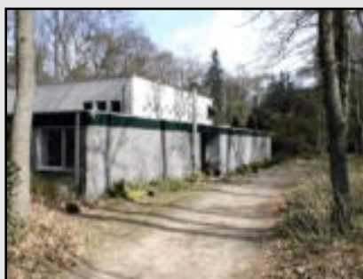
St. Michael and All Angels Meentweg 9, 1411 GR Naarden