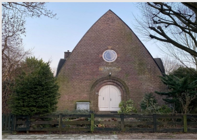
Na kap op 4 februari 2026

De buurt is erg betrokken bij het kerkje. De Raphaëlkerk is 100 jaar geleden gebouwd en op 28 november 1926 officieel gewijd. De insteek van de buurtgroep is het behoud van de kerk in volle glorie voor de komende 100 jaar.