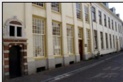
St. Maartenskapel Herenstraat 27, 3512 KB Utrecht